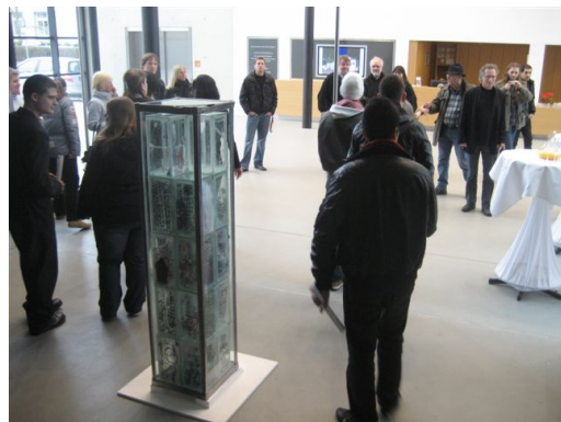
Freitagmittag: Eröffnung der Ausstellung im Emil Schumacher Museum Hagen