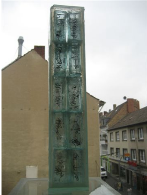
Modell der Stele, Atelier Clemens Weiss in Mönchengladbach

Der international renommierte Künstler Clemens Weiss erarbeitete am Rahel-Varnhagen-Kolleg mit Studierenden eine Stele aus Glas, die im Foyer des Hagener Emil Schumacher Museums ausgestellt wird.