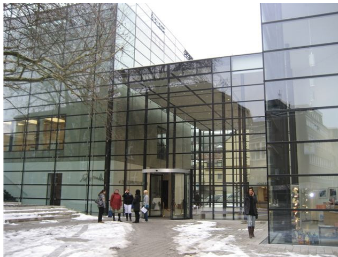
Emil Schumacher Museum Hagen