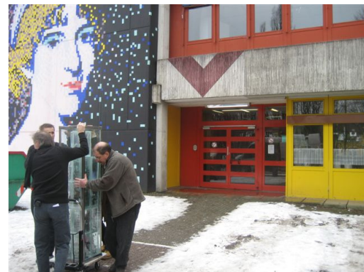
Freitagmorgen: Abtransport der Stele