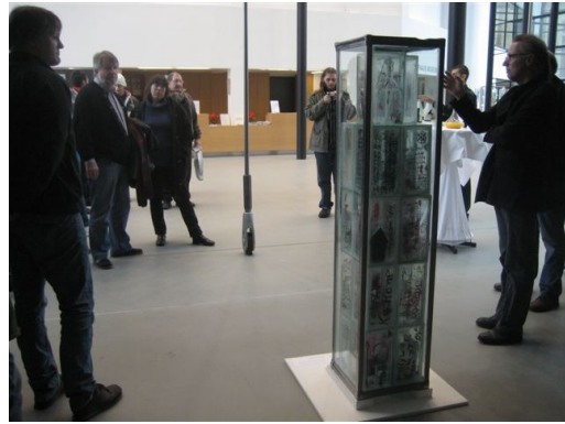
Freitagmittag: Eröffnung der Ausstellung im Emil Schumacher Museum Hagen