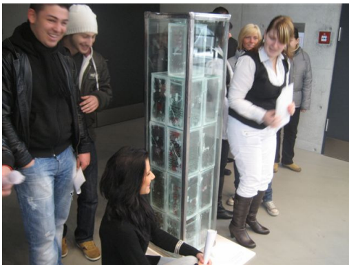
Freitagmittag: Eröffnung der Ausstellung im Emil Schumacher Museum Hagen