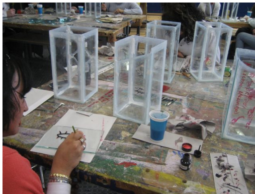
Mittwoch: Beschriften und Bezeichnen der Glastafeln