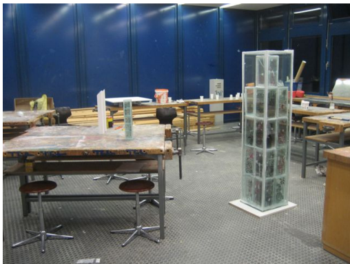
Donnerstagabend: Fertigstellung der Stele