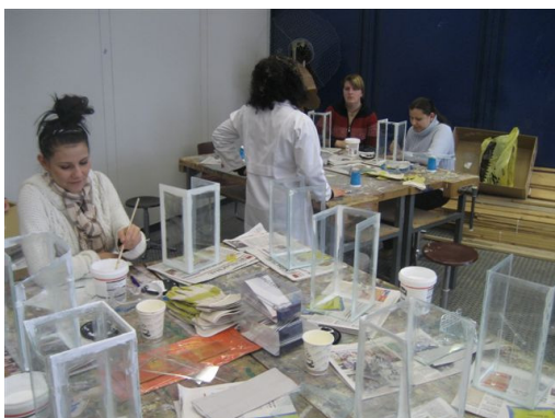
Dienstag: Fertigstellung der Einzelsegmente