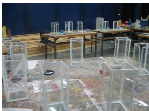
Fertigstellung der Einzelsegmente