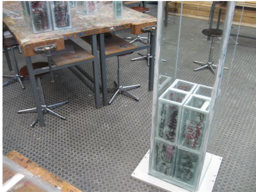
Donnerstagabend: Einfügen der Segmente in die Stele