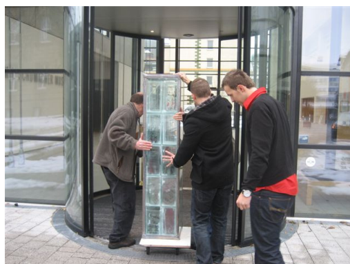
Freitagmorgen: Ankunft der Stele im Emil Schumacher Museum Hagen