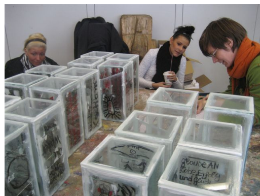
Donnerstag: Pressekonferenz; fertige Segmente