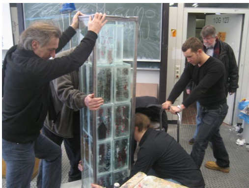
Freitagmorgen: Abtransport der Stele