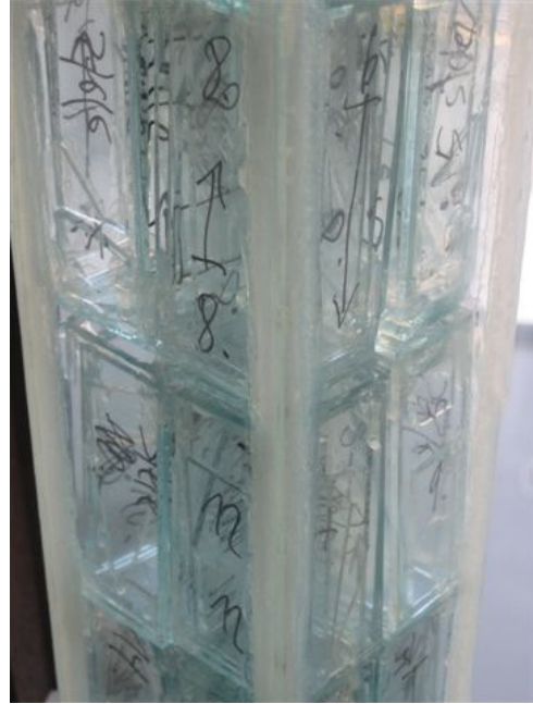
Detail der Stele