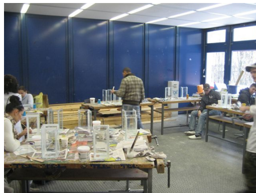
...gleichzeitiges Anfertigen der großen Stele