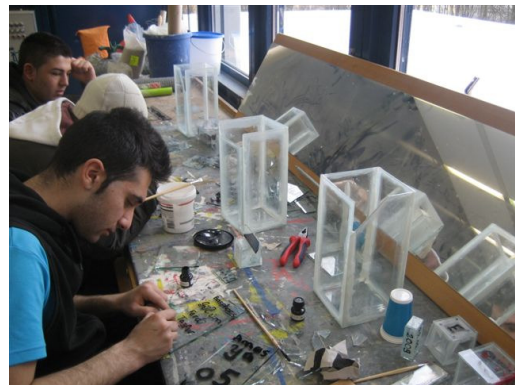
Beschriften und Bezeichnen der Glastafeln