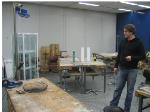
Donnerstagabend: Fertigstellung und Trocknen der Stele