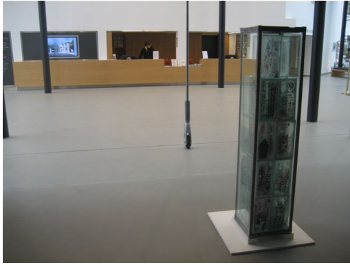
Freitagmittag: die Stele im Emil Schumacher Museum Hagen