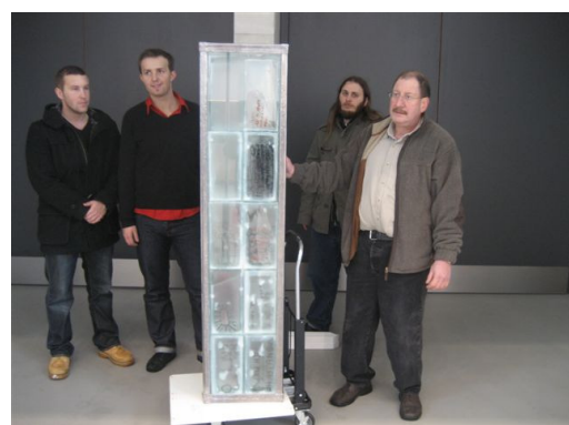
Freitagmorgen: Ankunft der Stele im Emil Schumacher Museum Hagen