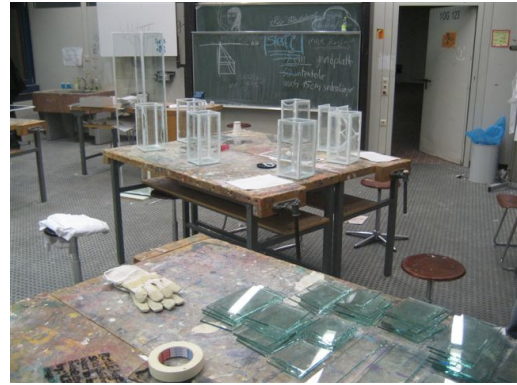
Vorbereitung der Glastafeln zum Beschriften