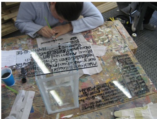
Mittwoch: Beschriften und Bezeichnen der Glastafeln