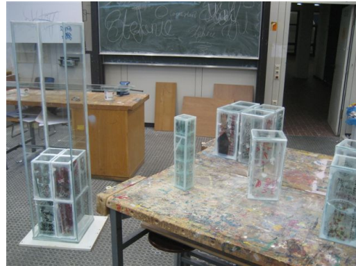
Donnerstagabend: Einfügen der Segmente in die Stele