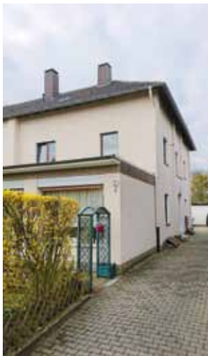
Abb. 3: Lokal der NSDAP-Ortsgruppe Emst, Auf dem Kämpchen 6, 2019

Ebenfalls 1933 setzten die Nationalsozialisten den demokratisch gewählten Oberbürgermeister ab und übernahmen auch in Hagen die Macht. Einige Emster wurden Opfer der Nazis, da die Parteien SPD und KPD sowie die katholische Kirche hier einen starken Rückhalt in der Arbeiterschaft hatten. Zu den aus politischen Gründen Verfolgten kamen Juden, Kranke, Zwangsarbeiter und ein junger Soldat hinzu. Auch einige der Täter lebten hier: Teile von Emst und Eppenhausem galten schon damals als besonders begehrte Wohnlagen, die auch die Nazis zu schätzen wussten.