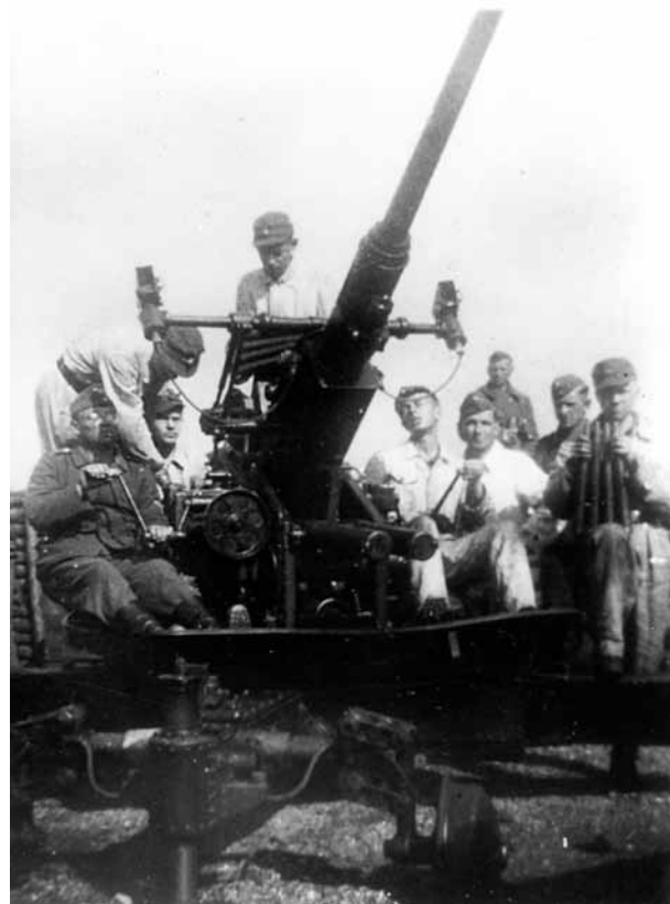
Abb. 30: Flakstellung am Kratzkopf, undatiertes Bild