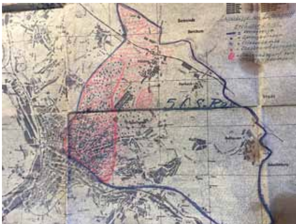
Abb. 35: Karte mit Bombentreffern auf Hagen, 1944. Emst befindet im unteren Teil der Karte.

Bei den großen Luftangriffen 1943 und 1944 blieben Emst und Bissingheim relativ verschont. Die lockere Bebauung trug zur Minimierung der Kriegszerstörungen bei. Trotzdem wurden mehrere Häuser zerstört, z.B. an der Cuno-, Bergruthe- und Schultenhardtstraße. Als amerikanische Soldaten in den letzten Kriegstagen aus Richtung Delstern anrückten, wurde Emst von deutscher Artillerie bombardiert.