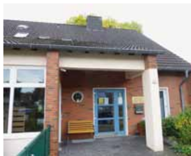
Abb. 17: Kath. Kindergarten, 2019

Nach der Niederlage 1945 wurde hier von der Caritas eine Großküche für Flüchtlinge und Ausgebombte eingerichtet. Der heutige Kindergarten wurde 1959 eröffnet.