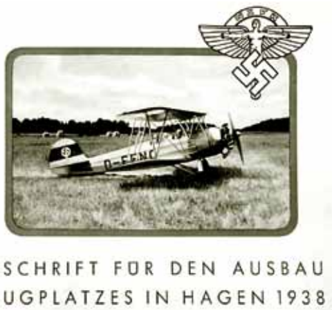
Abb. 29: Flugzeug auf dem Flugplatz Emst, 1938

„Die Tage verliefen gleichförmig; die Nächte blieben durch häufige Feuerbereitschaft schlafraubend und aufregend.“