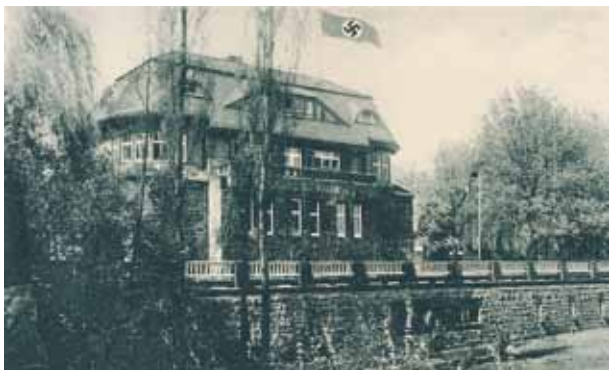
Abb. 31: Hohenhof, 1934

Diese Ideen, mit denen die Nazis später Diktatur und Vernichtungskrieg rechtfertigten, wurden ab 1933 im Hohenhof vermittelt: Ab diesem Jahr wurde die Villa von der NSDAP als „Gauschulungsburg“, also als Bildungszentrum für Nazi-Funktionäre, genutzt. Vorträge über Rassenlehre, Geschichte, Geopolitik, Verwaltung oder Sport waren in den reichsweit ca. 70 „Gauschulungsburgen“ bzw. „Gauführerschulen“ üblich. Auch einen Schießstand soll es am Hohenhof gegeben haben. Ab 1939 diente das Gebäude als Lazarett.