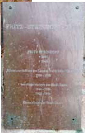
Abb. 16: Gedenktafel im Fritz-Steinhoff-Park, 2019