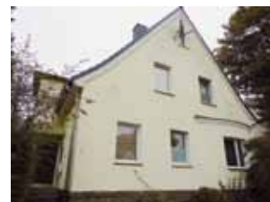
Abb. 28: Emster Str. 57, 2019