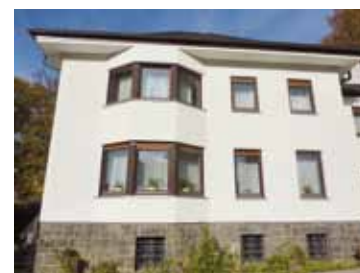
Abb. 24: Vikarhaus, Willdestr. 19, 2018

1941 wurde er wegen seiner kritischen Haltung zum Nationalsozialismus denunziert und von der Gestapo verhaftet. Er kam ins KZ Dachau in den sogenannten „Pfarrerblock“ für unbequeme Priester. Dort starb er 1942 als Opfer von Menschenversuchen. Seine Leiche wurde eingeschert. Die katholische Kirche erklärte ihn zum Märtyrer.