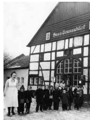
Abb. 18: Haus Sonnenblick, 1944