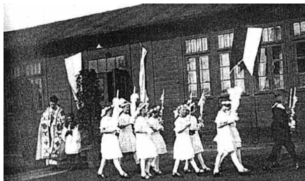
Abb. 20: Barackenschule, 1925

In den letzten Jahren diente die Baracke als Flüchtlingsunterkunft für deutsche Heimatvertriebene aus Osteuropa, bis sie schließlich 1960 abgerissen wurde. An ihrer Stelle steht heute der evangelische Kindergarten.