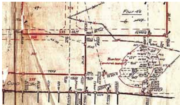
Abb. 36: Plan des Bunkers an der Cunostraße, vermutlich 50er Jahren