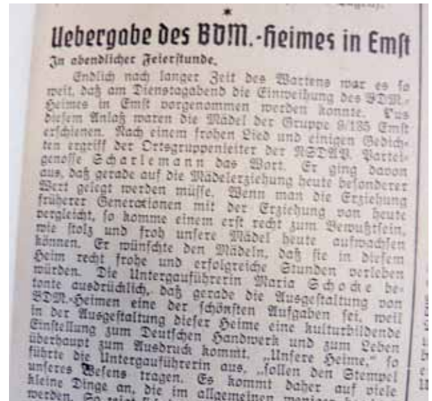
Abb. 2: Eröffnung eines Heimes des Bundes Deutscher Mädel, einer Unterorganisation der NSDAP, auf Emst, Hagener Zeitung, 14.4.1938