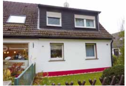
Abb. 12: Ehemaliges Haus der Familie Schäfer, 2019