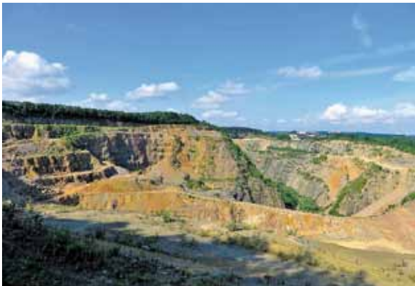
Abb. 33: Steinbruch an der Donnerkuhle, 2018

Bei bester Gesundheit kann ich Dir endlich schreiben wo ich bin. [...] Ja liebes Muttelchen! Nun bin ich wieder eingesperrt. Dafür, dass ich Dich gesehen habe, lass ich mich schon einsperren. Heute in 8 Tagen ist Heiliger Abend. Dann fällt mir bestimmt schwer. Aber wir dürfen nicht den Kopf hängen lassen. Nach diesem Dezember kommt wieder ein Mai! Wir wären doch nicht Weihnachten zusammengewesen. Schwer war der Abschied im Hausflur, doch schön ist das Wiedersehen. Denk nur an die Mütter, deren Söhne gefallen sind, und Deiner lebt doch noch. Liebe Mutti! Ich melde mich jetzt freiwillig nach Rußland und werde dort beweisen, dass ich nicht feige bin. [...] Nun mach dir keine Sorgen mehr, es soll schon noch einmal gut gehen. Dein Sohn ist ja kein Verbrecher. Was ich tat, war ja nur für Dich, liebes Muttchen. [...] Die Zeit geht mir gut um, den ganzen Tag lese ich. Nur eines habe ich. Hunger! Wenn Du kannst, schick mir doch bitte etwas zu essen.