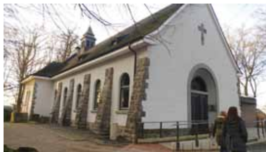
Abb. 25: Heinrich-König-Haus, 2018