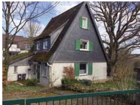
Abb. 4: Haus des NSDAP-Ortsgruppenleiters, An der Egge 17, 2019

Im April 1945 setzten amerikanische Truppen der NS-Diktatur in Hagen ein Ende. Mit den Folgen des Nationalsozialismus hatte man auf Emst, wie in ganz Deutschland, noch Jahrzehnte lang zu kämpfen: Das Fehlen der gefallenen oder ermordeten Verwandten, der Hunger, die Kriegszerstörungen, die Besatzung und die Aufnahme von Vertriebenen erschwerten den Alltag.