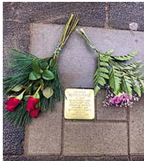
Abb. 8: Stolperstein für Heinrich Bohne, 2018