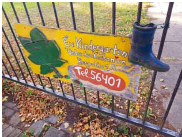
Abb. 19: Ev. Kindergarten, 2019

Da Emst lange keine Kirche hatte, wurden in der Barackenschule auch der evangelische und der katholische Gottesdienst gefeiert. Die Hitlerjugend und der Bund Deutscher Mädel trafen sich hier bis mindestens 1938.