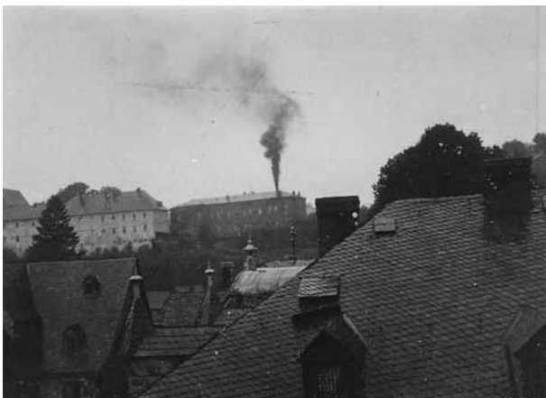
Abb. 11: Todesanstalt Hadamar, 1941