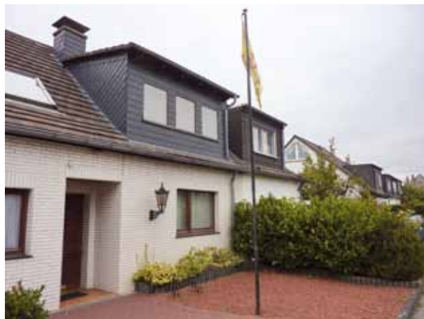
Abb. 10: Ehemalige Erwerbslosensiedlung an der Cunostraße, 2018