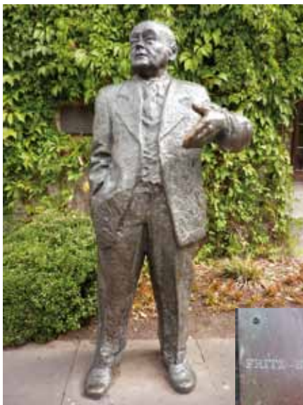
Abb. 15: Skulptur von Fritz Steinhoff vor dem Rathaus, 2018

Steinhoff war 1946 - 1956 und 1963 - 1964 Oberbürgermeister der Stadt Hagen, 1956 - 1958 NRW-Ministerpräsident. Seit den 50er Jahren wohnte er auf Ernst. 1967 wurde er Ehrenbürger der Stadt Hagen. Eine Infotafel vor seinem Haus und eine Gedenktafel im „Fritz-Steinhoff-Park“ neben dem Rahel-Varnhagen-Kolleg erinnern heute an ihn. Auch die erste Hagener Gesamtschule trägt seinen Namen.