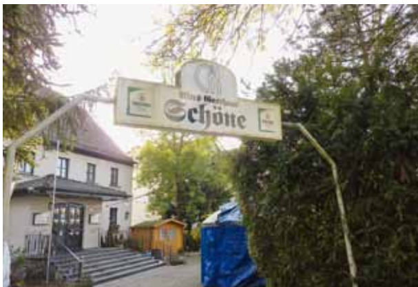
Ab. 21: Gaststätte Schöne, 2018

Neben der Gaststätte „Schöne“ stand während des Krieges ein „Fremdarbeiterlager“, ungefähr dort, wo heute der Parkplatz ist. Es ist belegt, dass dort polnische und französische Kriegsgefangene untergebracht waren. Laut einer Chronik der katholischen Gemeinde wurden diese seelsorgerisch betreut, was damals nicht selbstverständlich war: Polen galten als „Untermenschen“. Ihr Glaube gehörte zu ihrer nationalen Identität, die die Nazis schwächen wollten. Polnische Gottesdienste sind auf Emst nicht bezeugt, auch nicht im Lager.