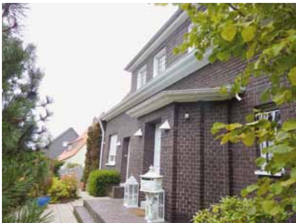
Abb. 26: Emster Str. 75, 2019

Die britische Besatzung dauerte offiziell bis zum 23. Mai 1949. An diesem Tag ging das Land NRW an die Bundesrepublik Deutschland über.