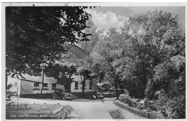
Ab. 22: Haus Schöne, 1935